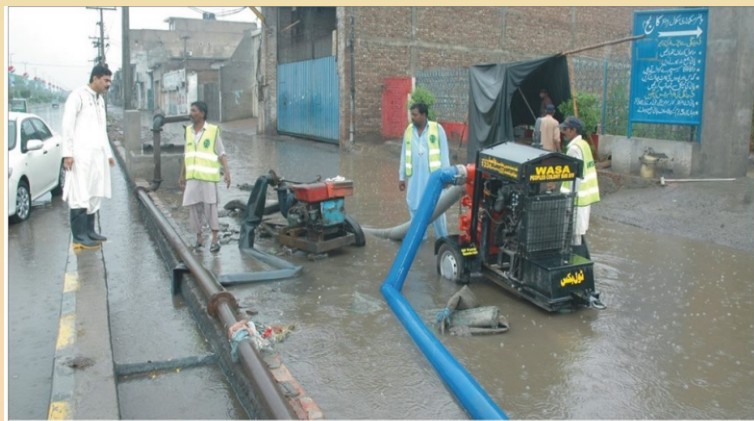
آباد پنجنگ ڈائریکٹریز زاہد عزیز عید کی بارش کے دوران سنڈری روڈ پر واسا ایمرجنسی ٹیم کی طرف سے فراہم کردہ پمپس کی مدد سے بارش پانی کے نکاس کا سائیز کر رہے ہیں۔