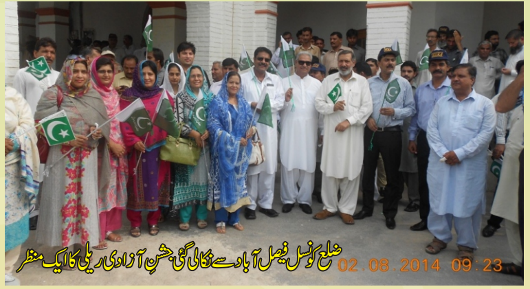
ضلع کونسل فیصل آباد سے نکالی گئی حسین آزادی ریلی کا ایک منظر 02.08.2014 09:23