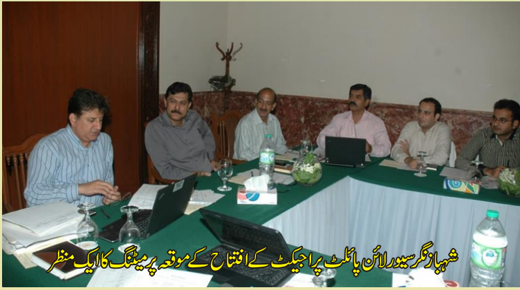
شہباز نگر سیورلائن پائلٹ پراجیکٹ کے افتتاح کے موقع پر میٹنگ کا ایک منظر