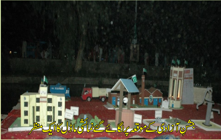
حسین آزادی کے موقع پر لگائے گئے نمائش ماڈل کا ایک منظر