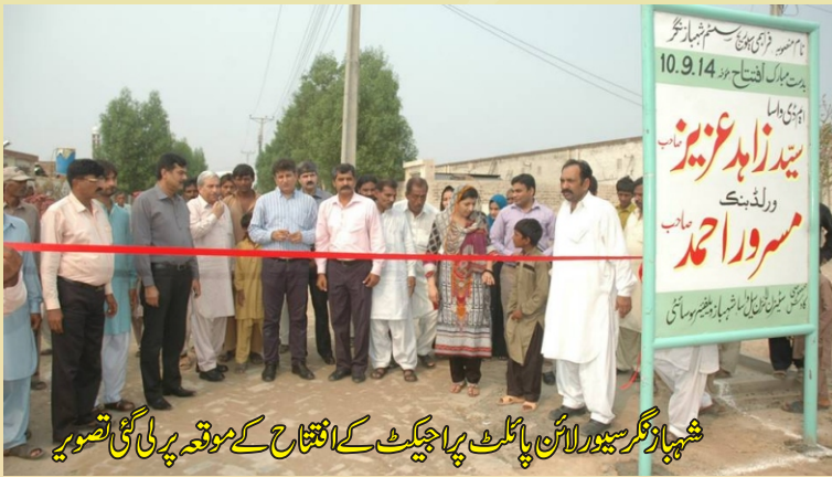
شہباز نگر سیورلائن پائلٹ پراجیکٹ کے افتتاح کے موقع پر لی گئی تصویر