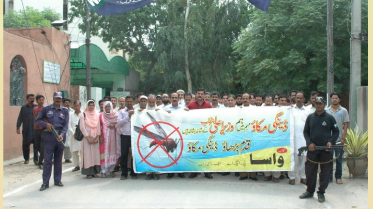
ضلع کونسل فیصل آباد چوک گھوگر ڈینگی آگہی واک کے مناظر